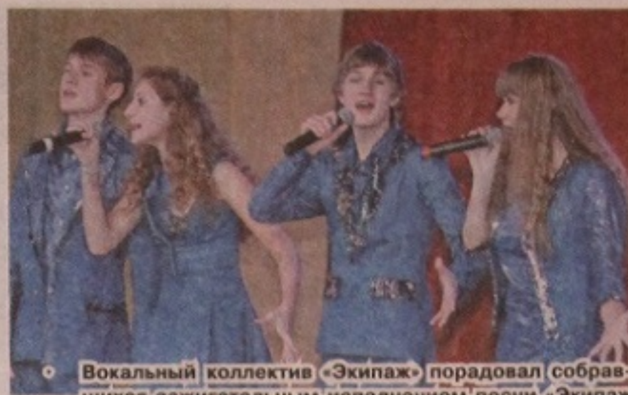
• Вокальный коллектив «Экипаж» порадовал собравшихся зажигательным исполнением песни «Экипаж - одна семья...»