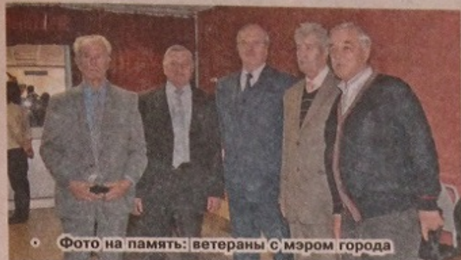
• Фото на память: ветераны с мэром города

В КСЦ «Мечта» 1 октября собрался «золотой фонд» города Одинцово: ветераны и дети Великой Отечественной войны, известные граждане Одинцово, активные представители общественных организаций, уполномоченные... Все те, кто, накопил огромный жизненный опыт и имеет полное право с чистой совестью давать советы и делиться своей мудростью с молодыми.