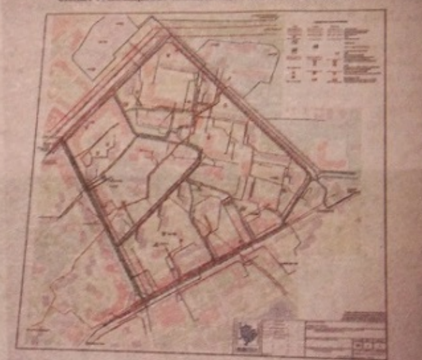
СХЕМА РАЗМЕЩЕНИЯ ИНЖЕНЕРНЫХ СЕТЕЙ И СООРУЖЕНИЙ