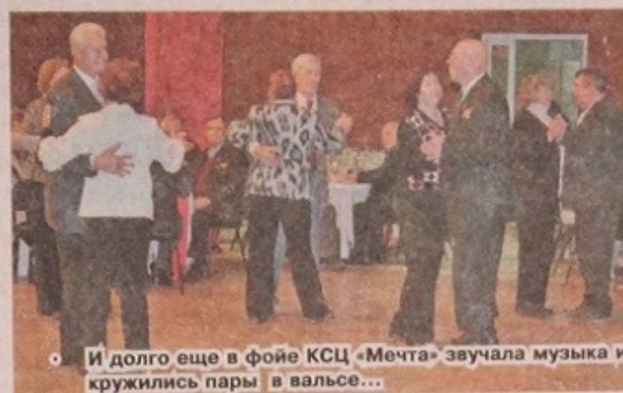
• И долго еще в фойе КСЦ «Мечта» звучала музыка и кружились пары в вальсе...