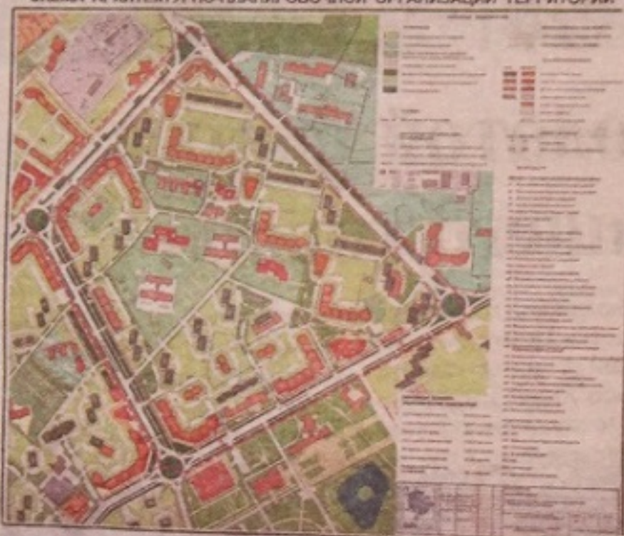
СХЕМА АРХИТЕКТУРНО-ПЛАНИРОВОЧНОЙ ОРГАНИЗАЦИИ ТЕРРИТОРИИ

будет выглядеть после завершения всех намеченных работ, а также схему размещения инженерных сетей и сооружений.