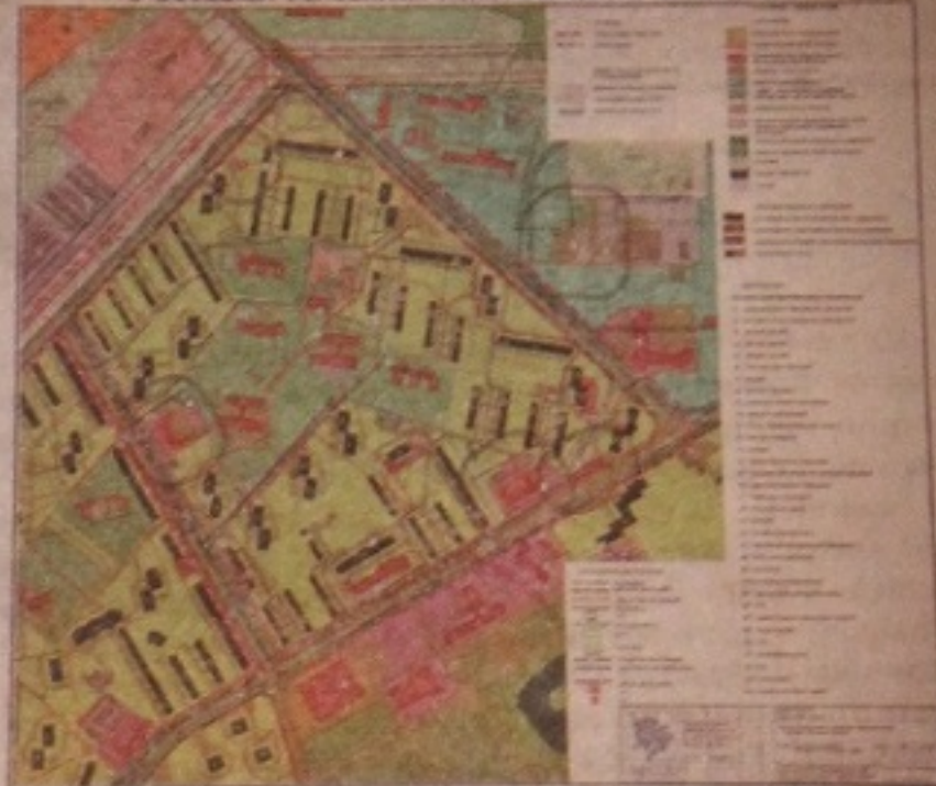
КОРРЕКТИРОВКА ПРОЕКТА ПЛАНИРОВКИ МИКРОРАЙОНА № 3 ОДИНЦОВО МОСКОВСКОЙ ОБЛАСТИ